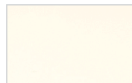
Aquarelle Soft White 3935 060